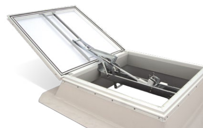
Cupolă luminoasă TOP-90 PLUS cu dispozitiv pentru evacuarea a fumului și a căldurii 24 V, montată pe sistemul de soclu

Indicație: Este posibilă transformarea ulterioară din TOP-90 în TOP-90 PLUS