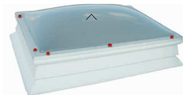
HAILSTOP, SUPER-TOP, PET-TOP